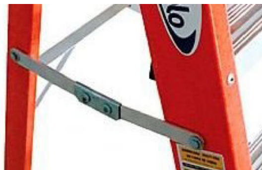
Limitador de Abertura